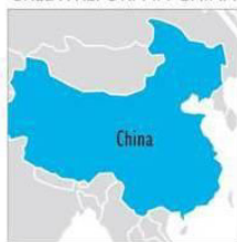
CREDITREFORM IN CHINA