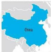
CREDITREFORM IN CHINA